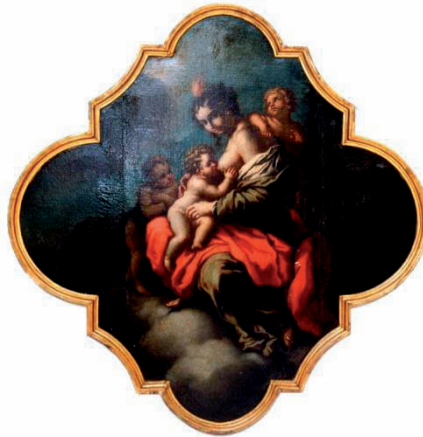
Dipinto ad olio raffigurante Madonna con Bambino e S. Giovanni - F. Giordano - sec.XVII- XVIII (Proprietà Cassa Forense)

La domanda deve essere presentata, a pena di decadenza, a decorrere dal compimento del sesto mese di gravidanza (26esima settimana di gestazione) fino al termine perentorio di 180 giorni dal parto.