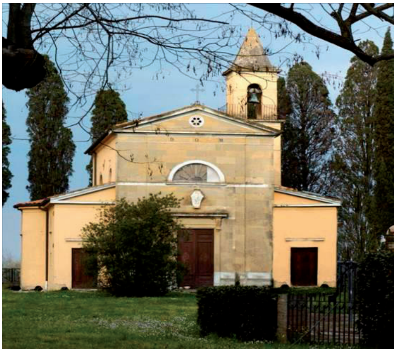
Cappella Gentilizia della Villa Carmignani a Collesalveti - Livorno (proprietà Cassa Forense)