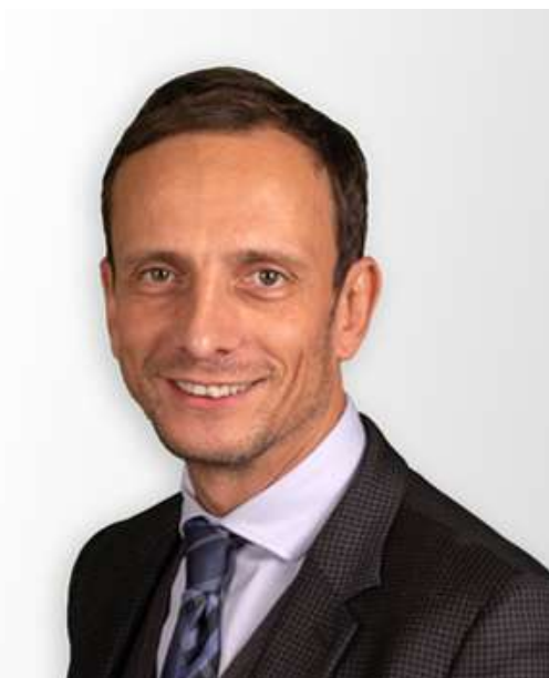
Dott. Massimiliano Fedriga Governatore della Regione Autonoma Friuli Venezia Giulia